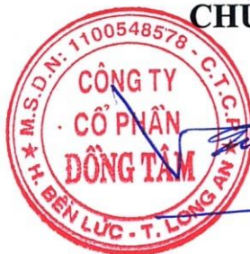
Võ Quốc Thắng