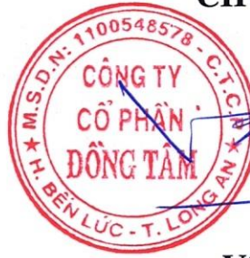
Võ Quốc Thắng